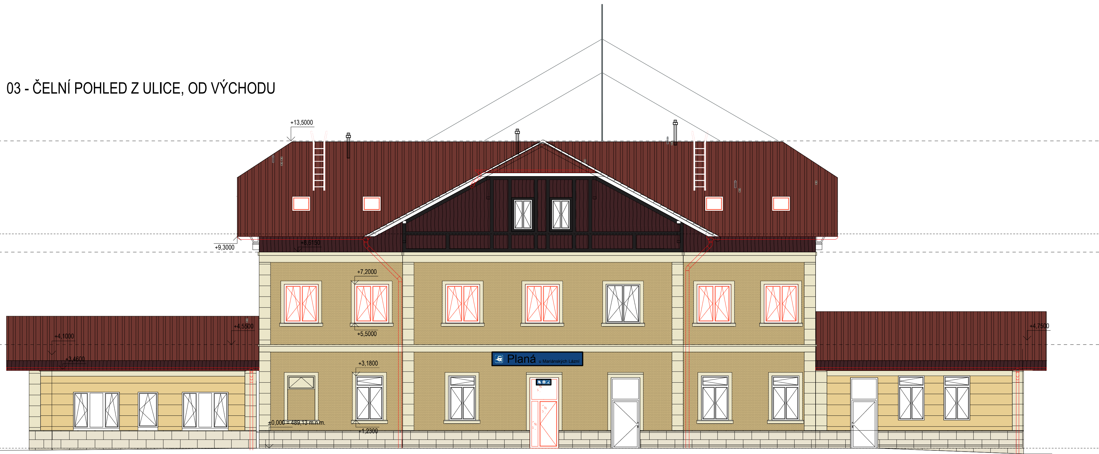
03 - ČELNÍ POHLED Z ULICE, OD VÝCHODU