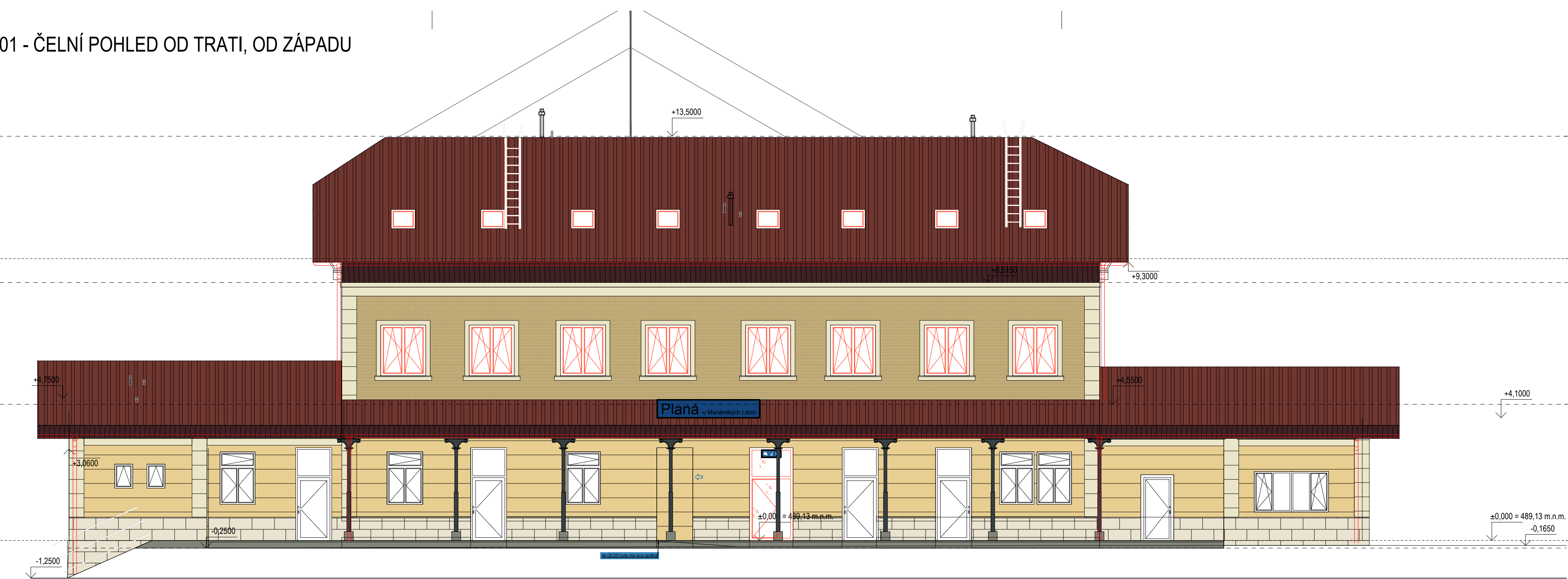
01 - ČELNÍ POHLED OD TRATI, OD ZÁPADU